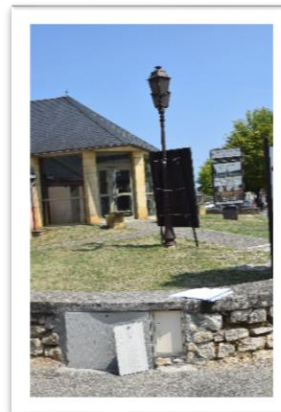
TABLEAU DE BORD DES INVESTISSEMENTS SUR LES PORTES DUCTAL