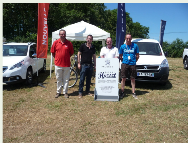
PEUGEOT Ets HERSZT