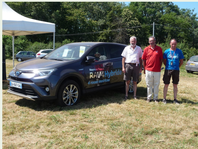
TOYOTA Ets MAGOT