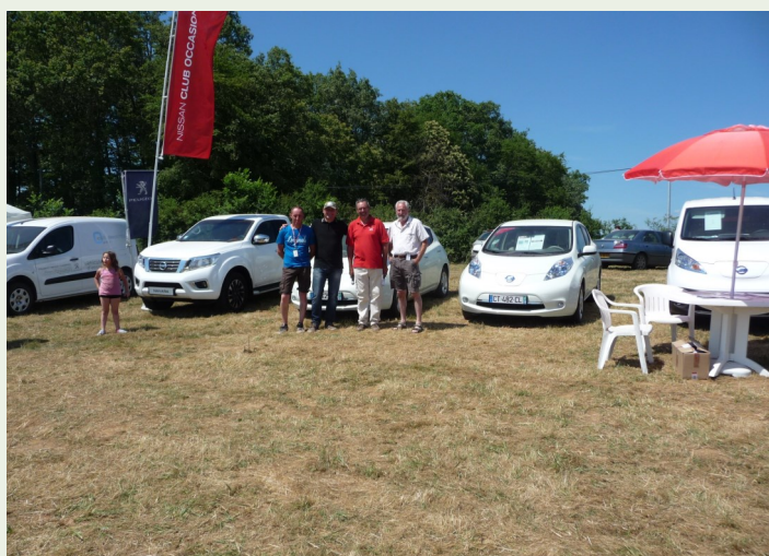
NISSAN Ets LAUDIS BRIVE