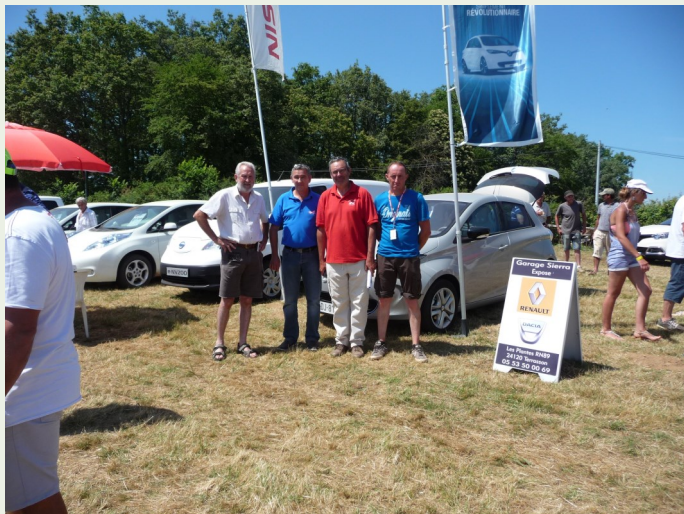
RENAULT Ets SIERRA