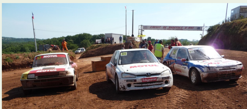
Auto Cross Tourisme