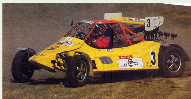
Auto Cross Monoplace