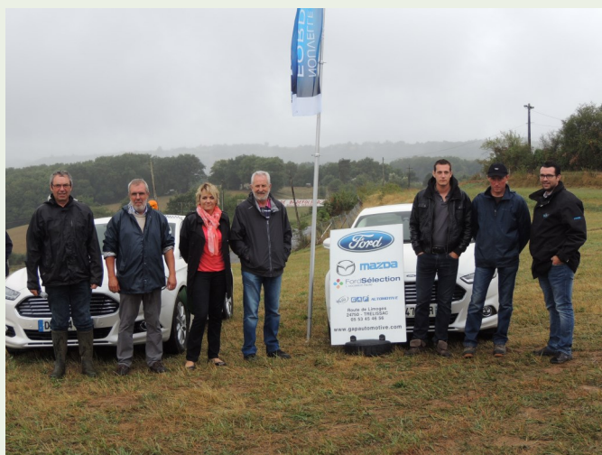
FORD MAZDA Ets GAP 24