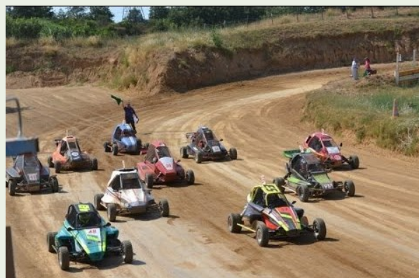
Auto Cross Sprint Car