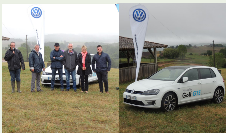
VOLKSWAGEN Ets LAGARDE