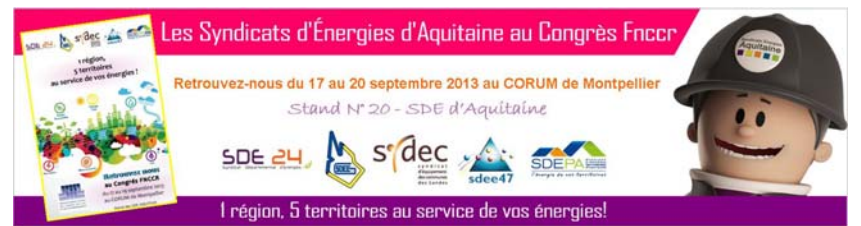
* Bandeau d'information grand public réalisé par le service communication du SDE 24 / AV.

Présentée en avant première lors du Salon des Élus locaux, la « Super Mascotte Énergies » était de retour pour le plus grand plaisir des visiteurs, sur le stand commun des SDE Aquitaine au Congrès de la FNCCR (Fédération Nationale des Collectivités Concédantes et Régies).